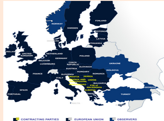
Vendet anëtare në Komunitetin e Energjisë

aktivitete të rëndësishme për Komunitetin e Energjisë nga Sekretariati i Energjisë në Vjenë. Bëhet fjale për Forumin Social dhe punëtorinë për konkurrencën në tregun energjetik rajonal. (alsat)